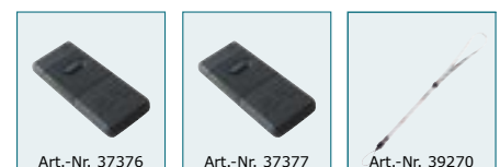
IR-Fernbedienung E (mit Zoomfunktion)