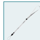
Sport Strap O-ST30