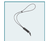
Leather Strap O-ST24